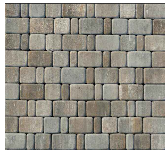
Тротуарная плитка Старый город Песчаник, (LxВxН) 60/120/180x120x60) Бортовой камень БР100.20.8 серый

Предусмотреть охранные зоны геодезических пунктов согласно Постановлению Правительства РФ от 12.10.2016г. №1037 "Об утверждении Правил установления охранных зон пунктов государственной геодезической сети, государственной нивелирной сети и государственной гравиметрической сети"